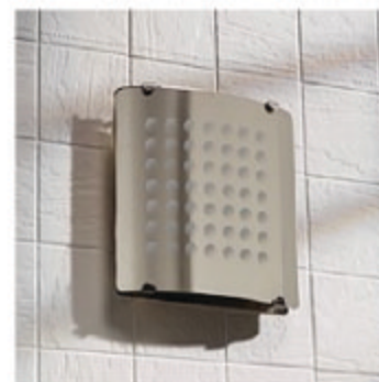
D160 Blip blip