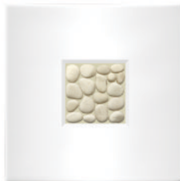
Stone the Crows