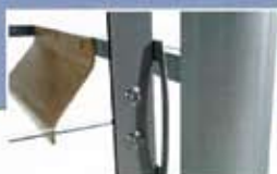
Συρόμενες πόρτες με λαβή