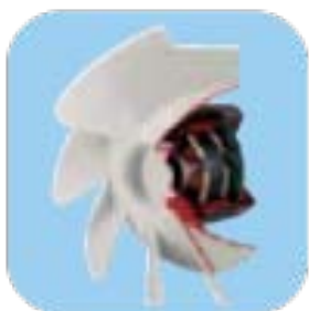
Brushless μοτέρ υψηλής απόδοσης χαμηλής κατανάλωσης με δυνατότητα ρύθμισης