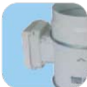
Ενσωματωμένες ηλεκτρονικές συνδέσεις