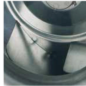
Φτερωτή φυγοκεντρική οπισθίας κλίσεως