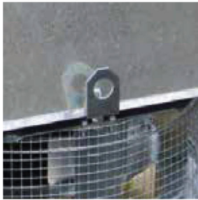
Εύκολη εγκατάσταση με στηρίγματα κρέμασης