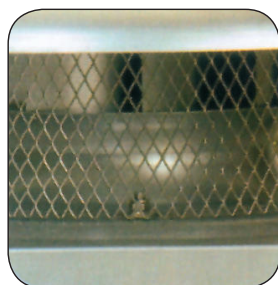
Ατσάλινο προστατευτικό πλέγμα