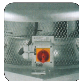
Διακόπτης ON/OFF πάνω στον εξαεριστήρα