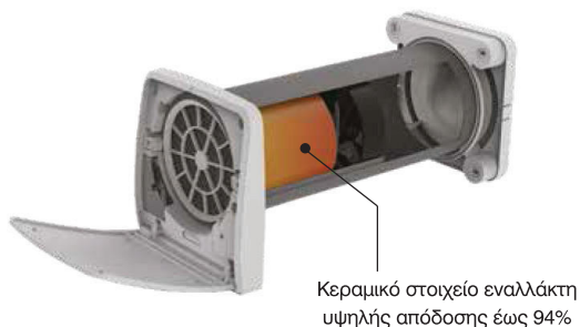
Κεραμικό στοιχείο εναλλάκτη υψηλής απόδοσης έως 94%