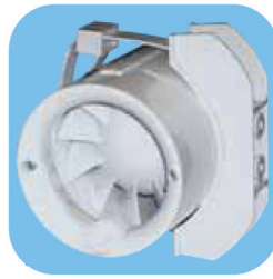
Βάση στήριξης τοίχου PIE-100/120