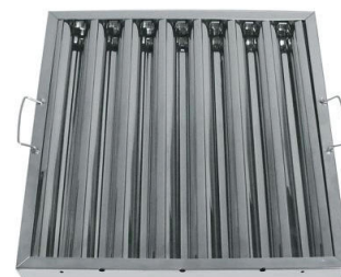
FIL - 50 Λιποσυλλέκτης, Φλογοκρίπτης