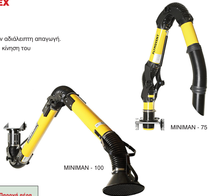
MINIMAN - 100