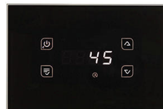
GLA / GLH ΜΑΥΡΟ