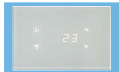
GLA / GLH ΛΕΥΚΟ