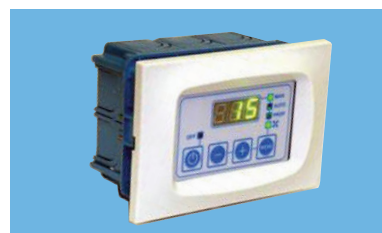
FC - 810