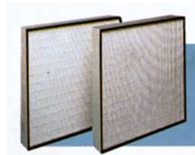
FAT - 50