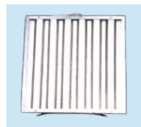
FIL - 50 Λιποσυλλέκτης, Φλογοκρύπτης