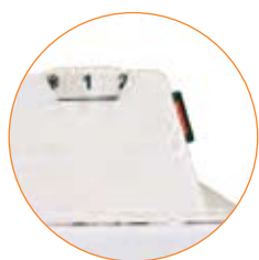
Ενσωματωμένος ρυθμιζόμενος θερμοστάτης χώρου

® Με την εγγύηση της Soler & Palau Ισπανίας