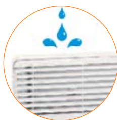
Προστασία από σταγονίδια νερού